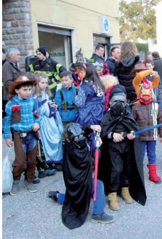
Mascherine in piazza

Grande successo ha ottenuto anche quest'anno a Novaledo il "carnevale masarolo" svoltosi nel pomeriggio di domenica 4 febbraio e organizzato dal locale Gruppo Alpini in collaborazione con i Vigili del Fuoco e il Comune. Più di cento mascherine, venute anche dai paesi vicini, hanno sfilato per la via principale capeggiate da alcuni pompieri e sono poi ritornate nella grande piazza Municipio, dove sono stati distribuiti piatti di spaghetti e gostoli a tutti.