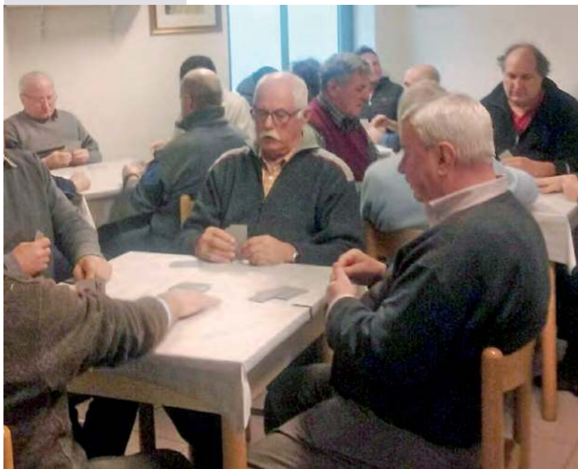
Anziani al torneo di briscola