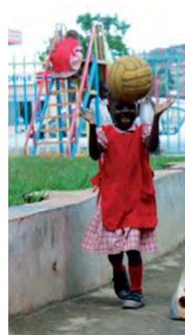
Felicità e amore tra i bambini africani

Ho anche collaborato con un'associazione che cerca di dare una speranza alle famiglie più vulnerabili e un futuro ai bambini che si trovano a vivere negli slums. Quest'esperienza è stata la più forte, sotto tutti i punti di vista. Ti apre gli occhi, ti ruba il cuore e ti chiude lo stomaco.