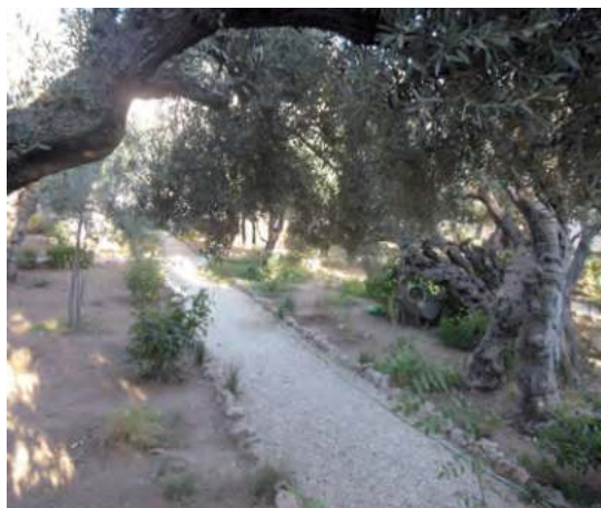
L'orto degli ulivi a Gerusalemme

Santa Messa 2 aprile, Lunedì dell'Angelo a Santa Brigida ore 9