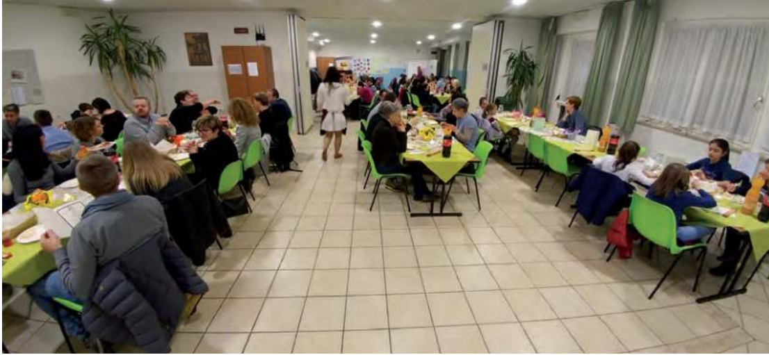
La cena comunitaria all'oratorio