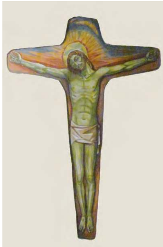
Il Crocefisso all'interno della chiesa delle Suore

Gesù Crocefisso: Colui che si è spogliato della sua potenza diventando umiliato fino alla morte di croce, esaltato da Dio Padre che l'aveva costituito Signore della terra e del cielo, della storia e dell'eternità (cf. Fil 2,6-11). L'immagine grande e al contempo mesta del Cristo in croce, che campeggia dietro l'altare della chiesa delle suore di Maria Bambina, invita l'osservatore ad una seria riflessione sul significato di quel modo