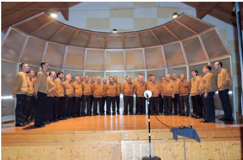
Il Coro Lagorai

esattamente 75 anni fa, ma soprattutto commemorare chi da quelle terre non è più ritornato.