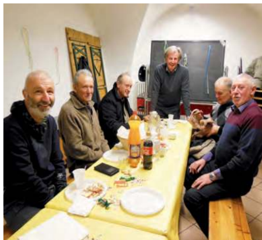
Momenti conviviali al Circolo pensionati

A breve il Circolo Pensionati e Anziani organizzerà altri incontri con lo scopo di coinvolgere più persone del paese, quelle più anziane magari un po' più restie ad uscire