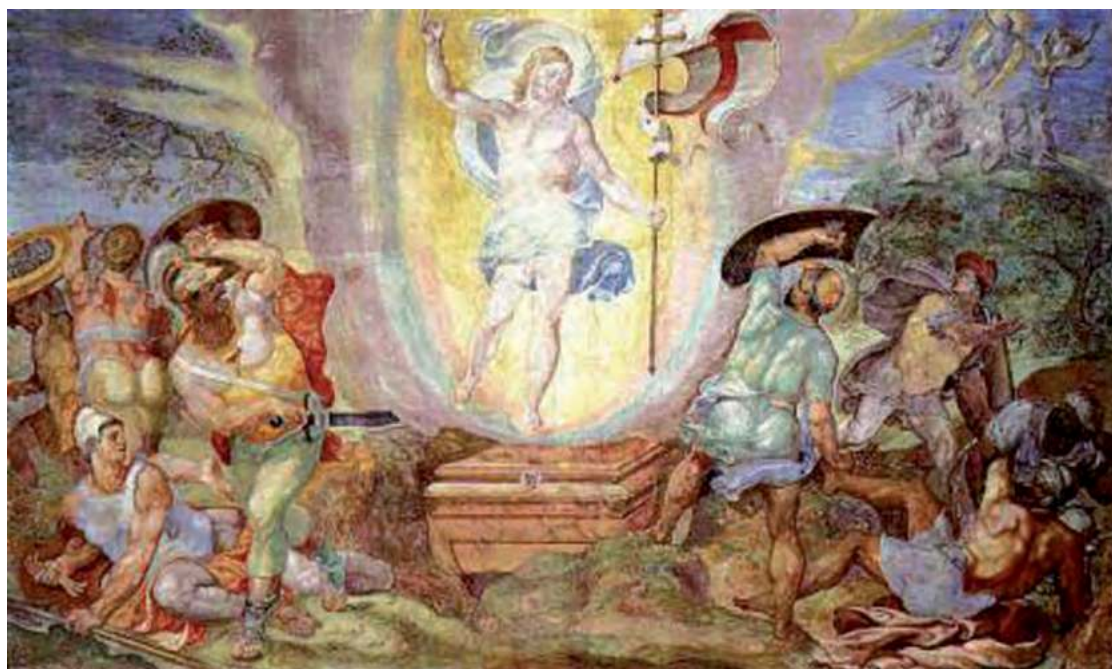
"Resurrezione di Cristo" - Ghirlandaio e Van den Broeck

Nel numero precedente, a proposito della visione dell'Inferno, da parte dei tre pastorelli di Fatima, la frase corretta a pag.12 è la seguente <<Loro sapevano com'era l'Inferno perché nell'apparizione di luglio la Madonna glielo aveva mostrato e ne erano rimasti sconvolti>>