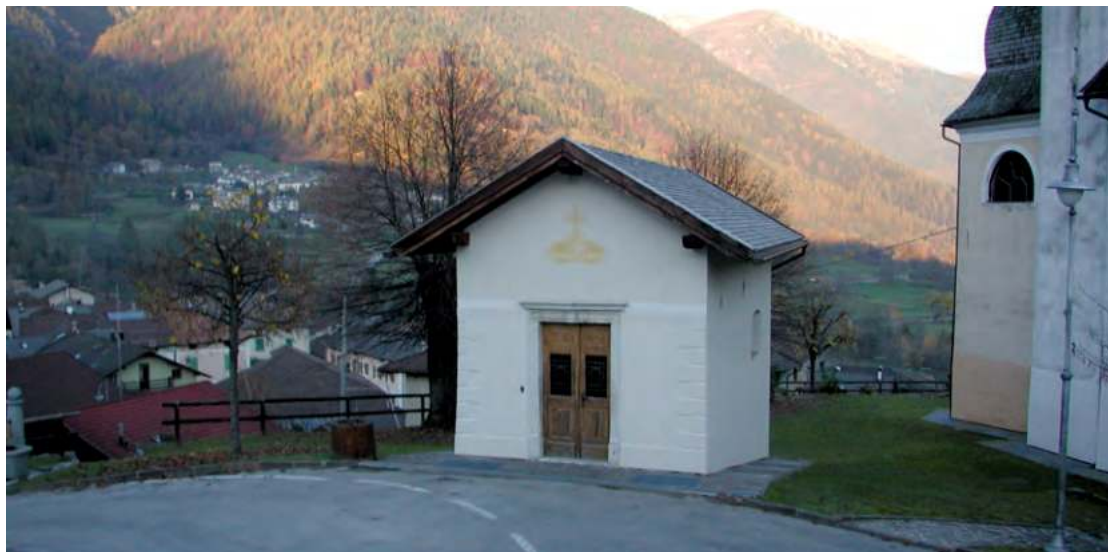
Chiesetta dei santi Antonio e Rocco