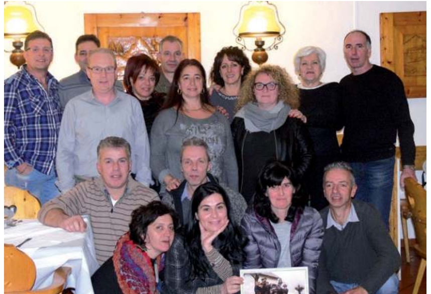
La classe 1966 ieri e oggi

tando un saluto di augurio con qualche canto e l'allegria dei bambini. Ormai da quasi un ventennio si ripete questa tradizione, che ogni anno diventa sempre più attesa dalle persone anziane, generose nel preparare qualche dolcetto o caramelle per i più piccoli, ma soprattutto con il cuore aperto ai bisogni dei bambini poveri del mondo; infatti in questa occasione sono state raccolte 530 euro da devolvere al centro missionario diocesano per la giornata dell'Infanzia missionaria. Un grazie di cuore a tutte le persone di buona volontà che con il loro contributo hanno reso possibile alleviare il lavoro di molti missionari trentini nel mondo.