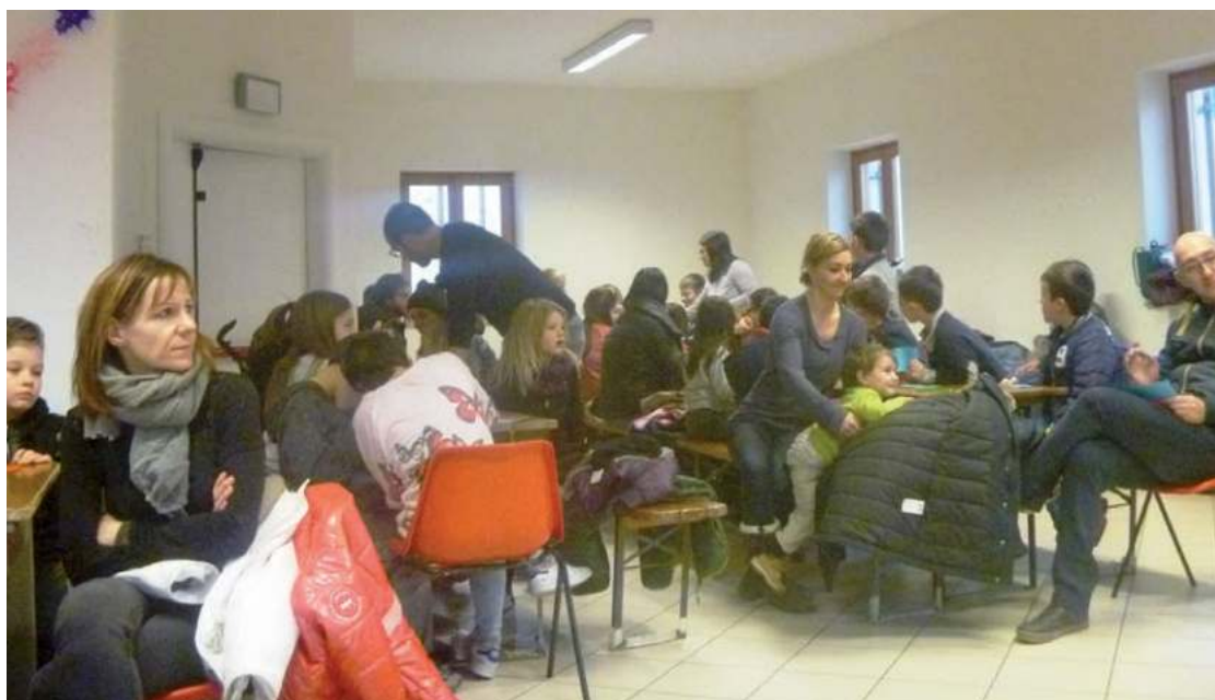
I numerosi partecipanti alla tombola

● Organizzata dalla Filo di Olle è tornata, come ogni anno, la seguitissima rassegna teatrale dialettale, ospitata presso il teatro dell'oratorio parrocchiale di Olle.