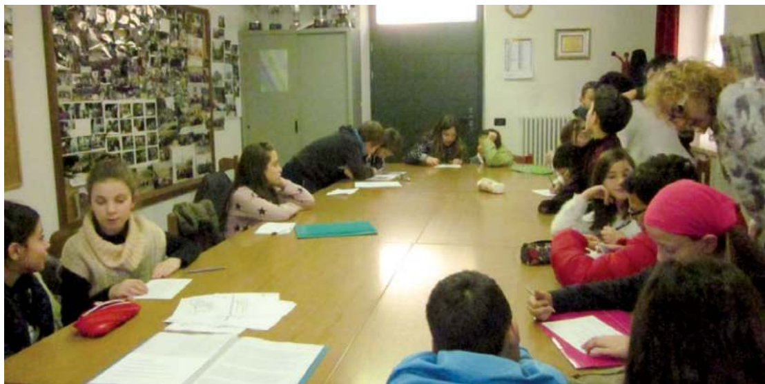
Il gruppo di catechesi della V classe durante il momento del dialogo