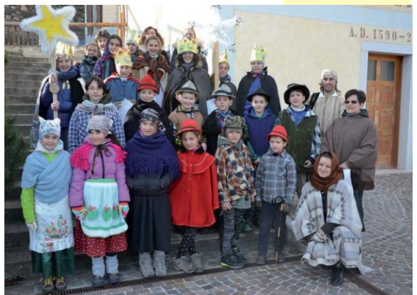
I "cantori della stella" Benedizione del sale