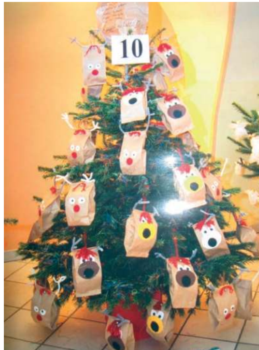
L'albero di Natale addobbato dai bambini della Scuola materna di Castelnuovo