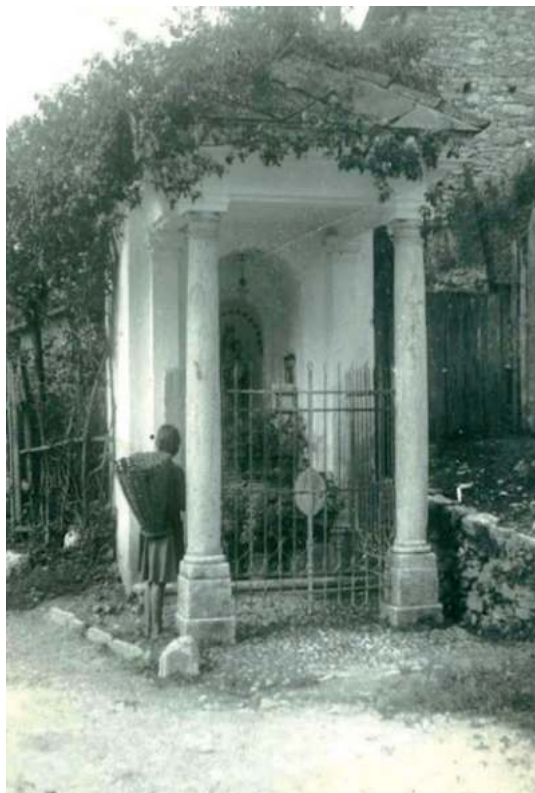
Il capitello di Nostra Signora in una foto degli anni '40

La padronanza del linguaggio architettonico, l'attento controllo sulle proporzioni dei volumi unitamente alle soluzioni architettoniche e formali proprie di un maturo stile neoclassico di chiara influenza veneta, confermerebbero una datazione posteriore alla seconda