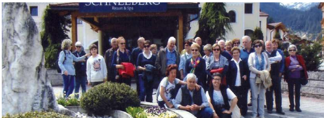
Il circolo pensionati in Val Ridanna

Infine un grazie di cuore alle brave signore del direttivo per la loro disponibilità!