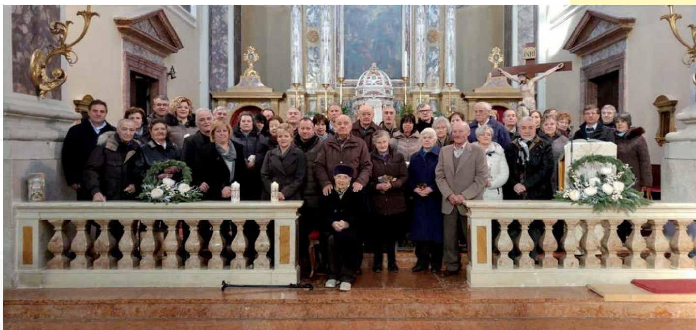
Foto ricordo delle coppie